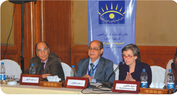
جلسة حوارية مع المفكرين