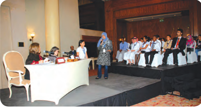
جلسة حوارية مع الأطفال

والخروج بتوصيات يتم تقديمها في المؤتمر العربي الرابع رفيع المستوى لحقوق الطفل الذي عقدته جامعة الدول العربية في مدينة مراكش المغربية خلال الفترة من ١٩ - ٢١ ديسمبر ٢٠١٠.