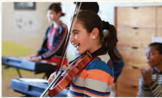
الصور منتقاه من فعاليات منتدى المجتمع المدني العربي للطفولة