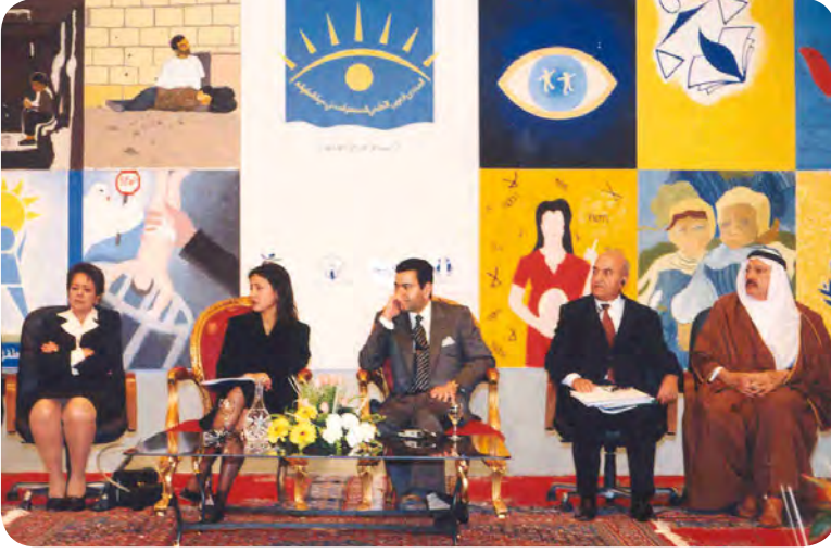
الجلسة الافتتاحية للمنتدى الأول

عقد المجلس العربي للطفولة والتنمية بالشراكة مع برنامج الخليج العربي للتنمية «أجفند»، وبالتعاون مع المعهد العربي لحقوق الإنسان والمرصد الوطني لحقوق الطفل بالمغرب ومكتب اليونيسف الإقليمي للشرق الأوسط وشمال إفريقيا، المنتدى العربي الإقليمي الأول لمنظمات المجتمع المدني حول الطفولة تحت رعاية جلالة الملك محمد السادس بالرباط بالمملكة المغربية خلال الفترة من ١٥ - ١٩ فبراير ٢٠٠١.