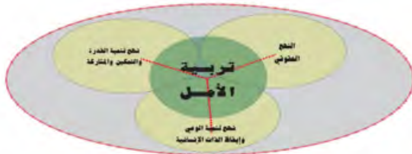
الإطار الفكري لنموذج تربية الأمل

يهدف هذا النموذج الشامل إلى تنمية وعي الطفل وإيقاظ ذاته المبدعة، وإطلاق طاقاته الإنسانية الخلاقة، وبناء قدراته، لمساعدته على العيش الكريم بما يحقق المواطنة الإيجابية. ويتطلب تحقيق هذا النموذج تقديمه إلى كل القوى المجتمعية والأفراد والمؤسسات والمنظمات وخاصة منظمات المجتمع المدني التي تعني بقضايا الطفولة لإدارة حوار عربي حول موضوع تنشئة الطفل، وكسب التأييد لنموذج عربي جديد لتنشئة الأطفال في البلدان العربية يتأسس في صميمه على تربية الأمل.