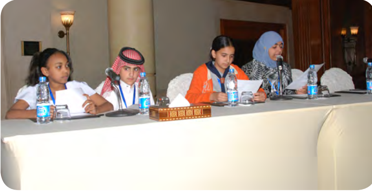
جلسة استعراض نتائج منتدى الأطفال

تحت رعاية صاحب السمو الملكي الأمير طلال بن عبد العزيز، عقد المجلس العربي للطفولة والتنمية، بالشراكة مع برنامج الخليج العربي للتنمية «أجفند»، منتدى المجتمع المدني العربي للطفولة الثالث تحت شعار «المعرفة من أجل الحق» وبالتعاون مع جامعة الدول العربية وهيئة إنقاذ الطفولة والمنظمة الكشفية العربية ومركز معلومات المرأة والطفل بمملكة