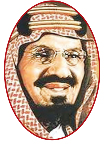
الملك عبد العزيز آل سعود

بمبادرة من صاحب السمو الملكي الأمير طلال بن عبد العزيز - رحمه الله- ومن منطلق اهتمام سموه بقضايا الطفولة والتنشئة والمواطنة باعتبارها قضايا ذات أولوية لتنشئة الطفل في البلدان العربية بغرض تكوين إطار فكري استرشادي لتنمية الأطفال في المجتمعات العربية، قام المجلس العربي للطفولة والتنمية بإنشاء جائزة في مجال البحث الاجتماعي والتربوي لتقديم دراسات وبحوث علمية حول قضايا الطفولة والتنمية ودعم حق الطفل في المشاركة والحماية.