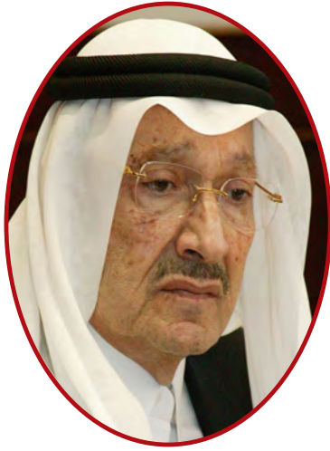
الأمير طلال بن عبد العزيز آل سعود