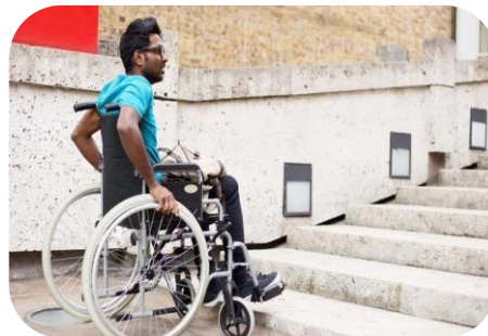
مخرجات التعليم لا تناسب سوق العمل