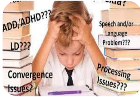
الحشو في المناهج