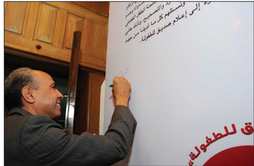
توقيع رئيس مجلس إدارة مؤسسة الإهرام على المبادئ المهنية معلناً مؤسسة الإهرام صديقة للطفولة (عام 2016).