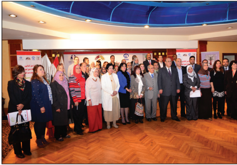
ورشة عمل إعلام صديق للطفولة - مصر عام 2015.