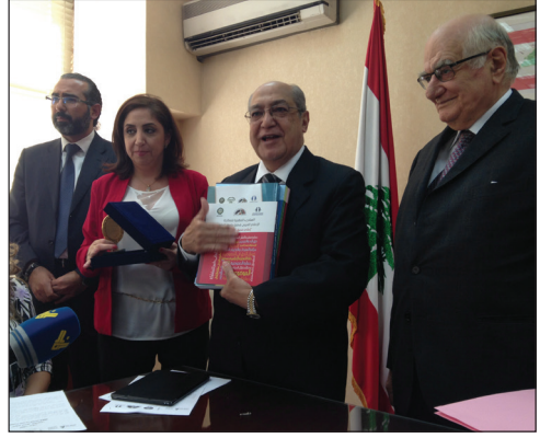
إطلاق المبادئ المهنية في بيروت برعاية معالي وزير الإعلام اللبناني - عام 2015.