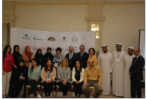
ورشة عمل إعلام صديق للطفولة - أبو ظبي عام 2015.