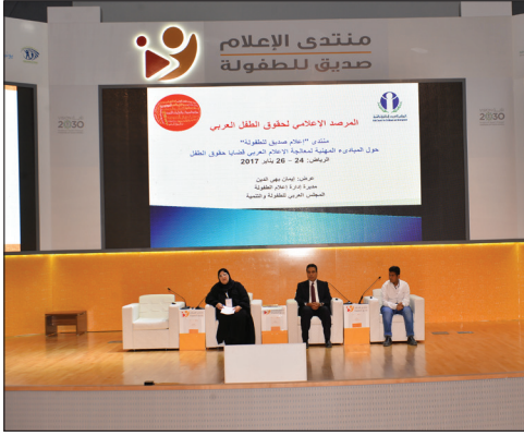
منتدى إعلام صديق للطفولة - السعودية عام 2017.

تم عقد 4 ورش عمل للتوافق على مسودة المبادئ المهنية مع الإعلاميين العرب في 4 دول عربية وهي: الإمارات - السعودية - لبنان - مصر، وتم إطلاق المبادئ المهنية في لبنان برعاية معالي وزير الإعلام اللبناني في شهر نوفمبر/ تشرين الثاني عام 2015.