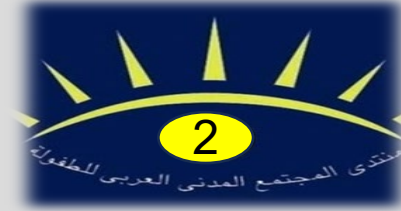
المنتدى الثاني 2005 بالقاهرة