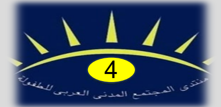
المنتدى الرابع 2012 في العاصمة البنانية بيروت