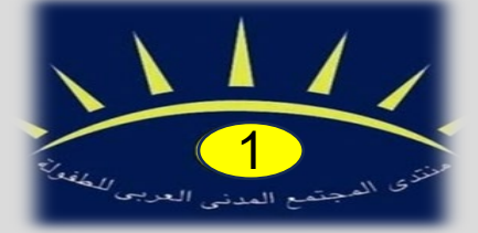
المنتدى الأول بالمغرب 2001