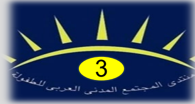
المنتدى الثالث 2010 بالقاهرة

يهدف منتدى المجتمع المدني العربي للطفولة مأسسة جهود منظمات المجتمع المدني العربي في مجال الطفولة، ويتبنى مقاربة حقوقية تنموية. ويقوم بدور محوري في بناء قدرات منظمات المجتمع المدني العربي العاملة في مجال الطفولة من خلال تحديد محور رئيس في كل دورة من دورات انعقاده.