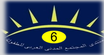
المنتدى السادس 2024 الإسكندرية بمكتبة