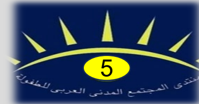
المنتدى الخامس 2018 بالقاهرة