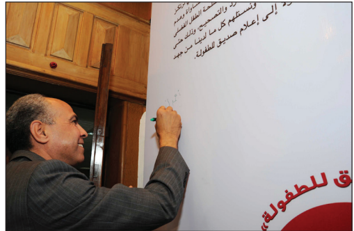
توقيع رئيس مجلس إدارة مؤسسة الإهرام على المبادئ المهنية معلناً مؤسسة الإهرام صديقة للطفولة (عام 2016).