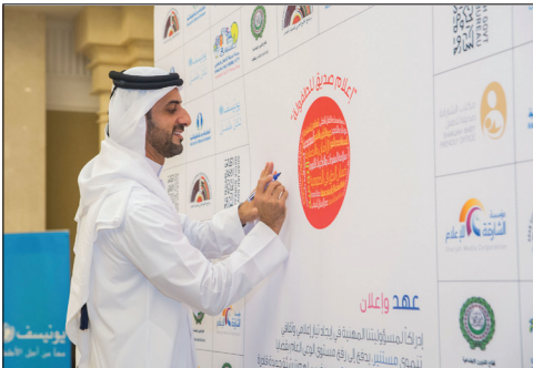
توقيع سمو رئيس مؤسسة الشارقة للإعلام على المبادئ المهنية معلناً مؤسسة الشارقة للإعلام صديقة للطفولة (عام 2017).

يستهدف المرصد توفير الأدوات العلمية والعملية التي تتيح توفير بيئة إعلامية داعمة ومناصرة لقضايا حقوق الطفل عربياً وتقديم الدعم الفني والاستشاري لتأسيس مراصد إعلامية وطنية.