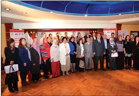
ورشة عمل إعلام صديق للطفولة - مصر عام 2015.