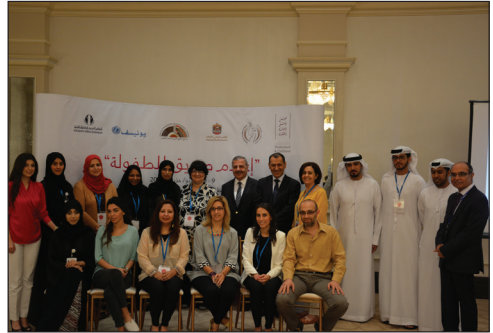
ورشة عمل إعلام صديق للطفولة - أبو ظبي عام 2015.